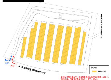
舞洲万博P&R駐車場D 場内案内