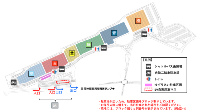
舞洲万博P&R駐車場AB 場内案内