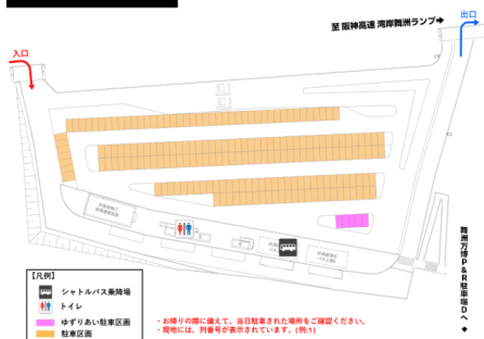
舞洲万博P&R駐車場C 場内案内