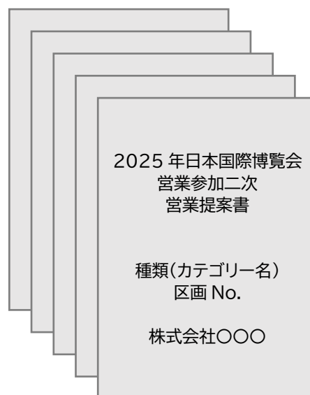
A4 縦フラットファイル綴じ(グレー色指定) 5冊1SET×希望店舗数