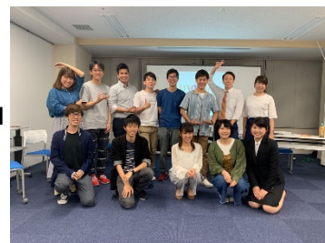
学生のパワーを集めよう！