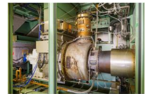
【アンモニアガスタービン】