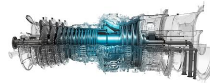
【水素ガスタービン】