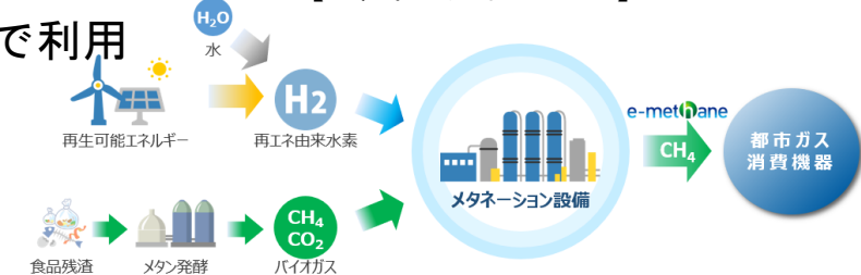
【メタネーションフロー】