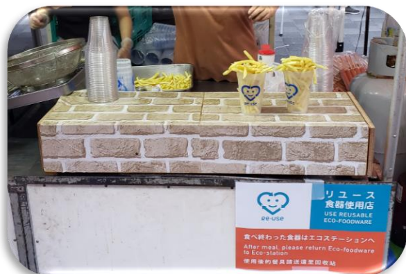
キッチンカーでの食品販売もリユース食器で