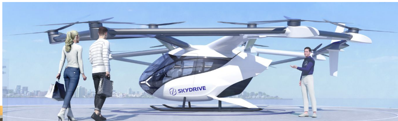
万博で飛行予定の機体イメージ図