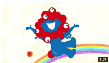
大阪・関西万博公式キャラクター「ミyakumiyak」プロモーションビデオ（90s） 6123 回視聴・1か月前