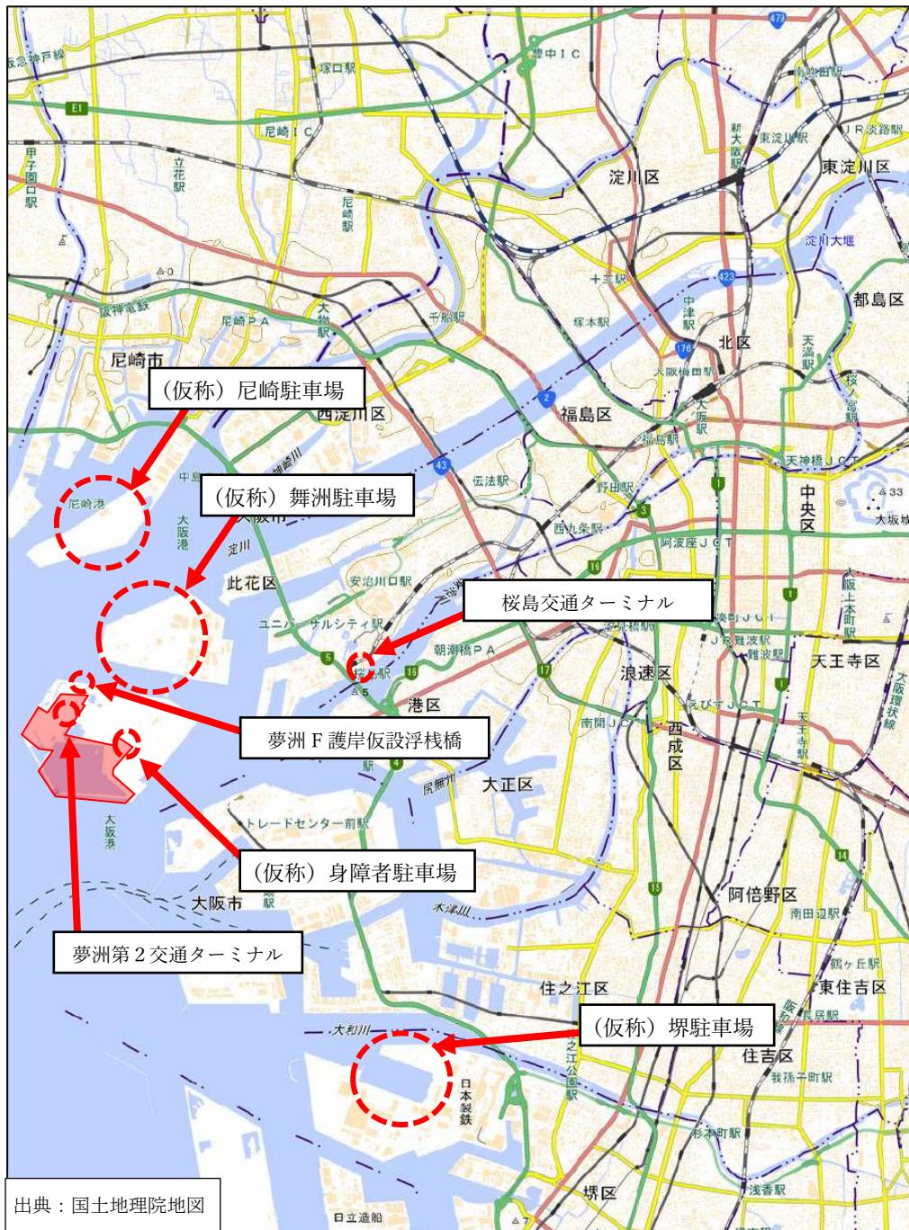
図 会場外駐車場位置図