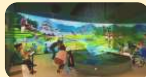
びわ湖を中心とした 持続可能ないとなみ