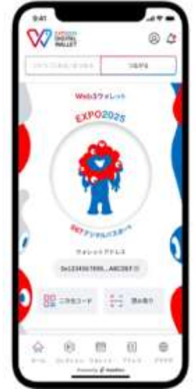
EXPO2025デジタルウォレットアプリ画面イメージ

北摂7市3町に設定された20スポット巡って、そのスポットならではのデザインのNFTをゲットしよう！