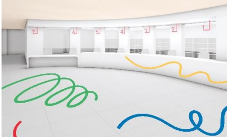
※画像は EXPO2025 WEST 郵便局