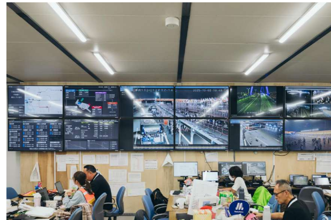
来場者輸送情報センター（モニター）