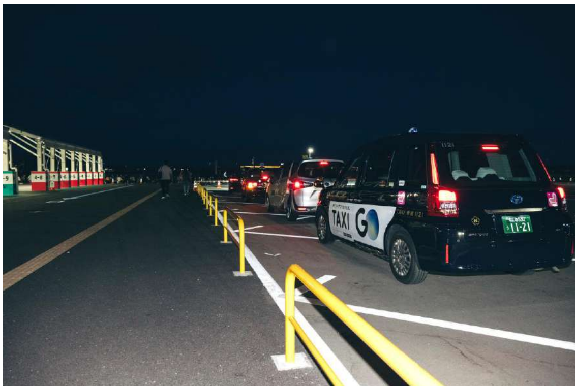
早朝のタクシー到着状況