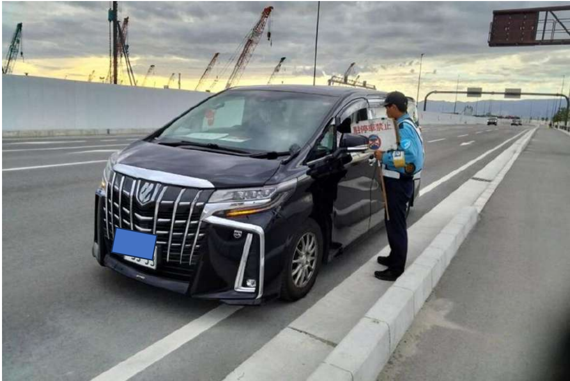
駐停車禁止の対応-警備員による声掛けの状況