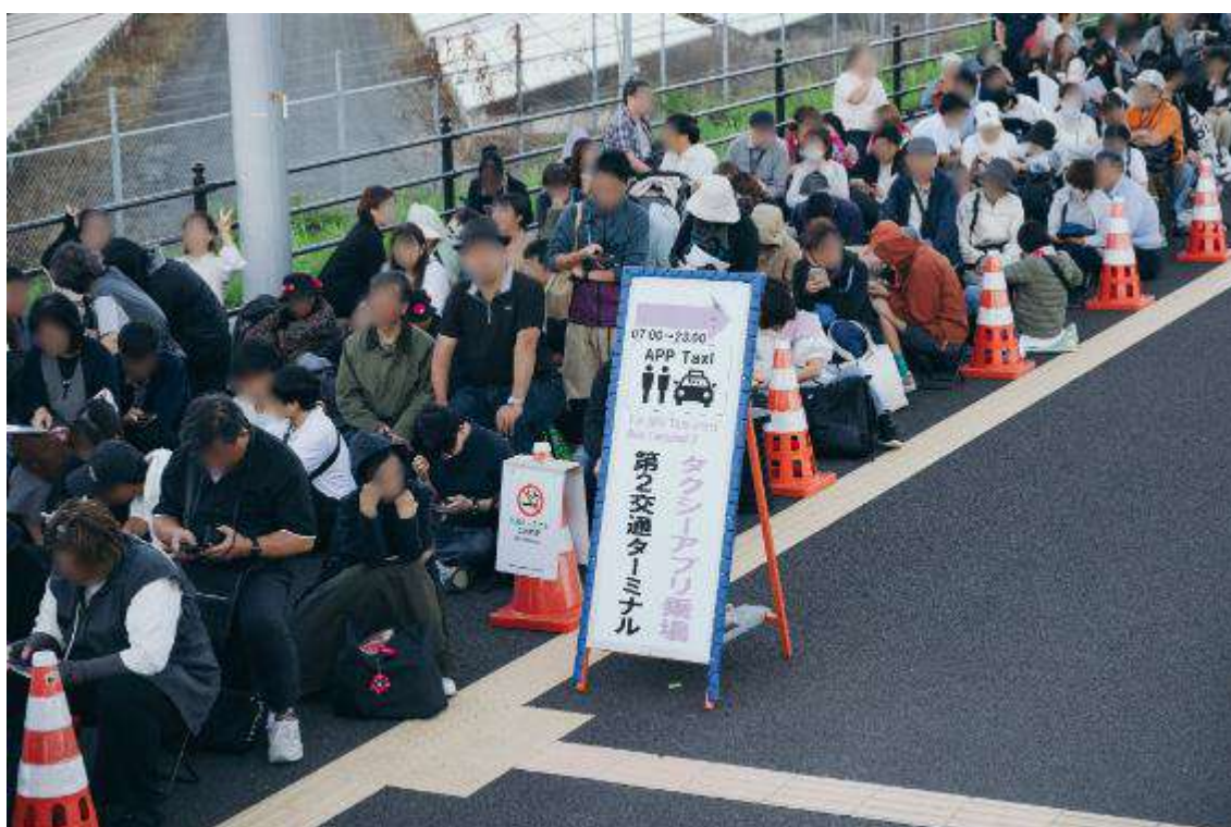
タクシー降車後の西ゲートへの移動待機列の様子