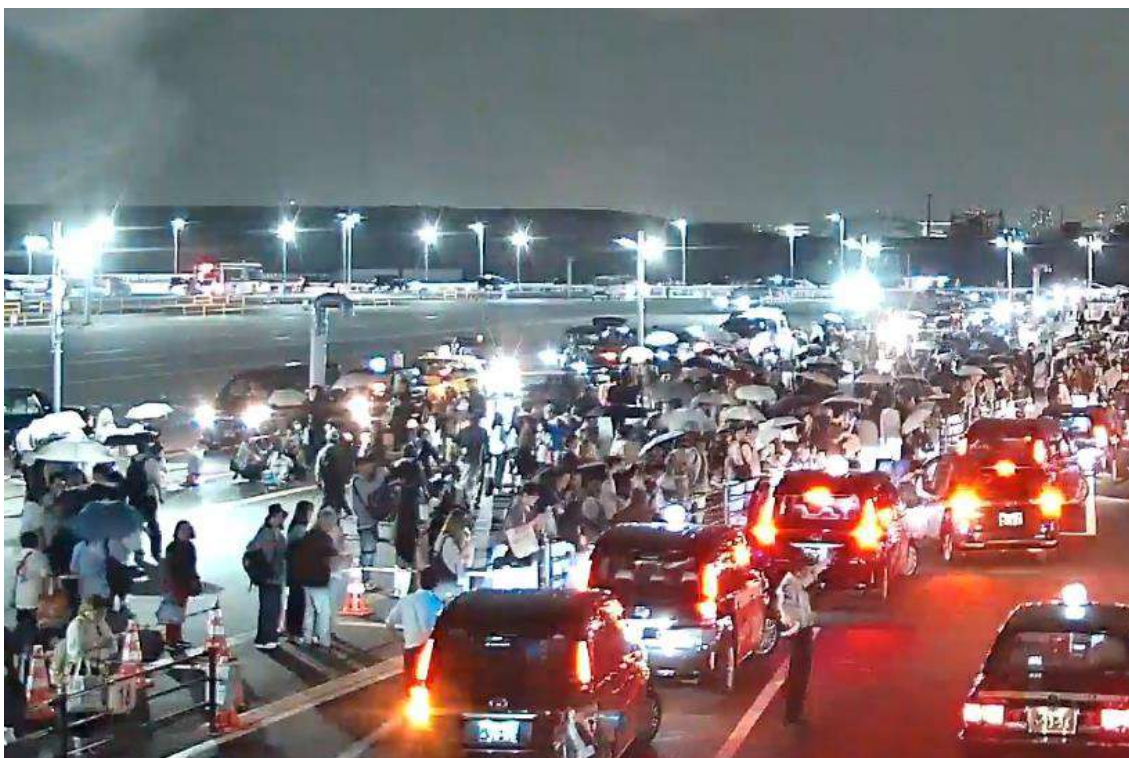
夜のアプリタクシー配車の様子