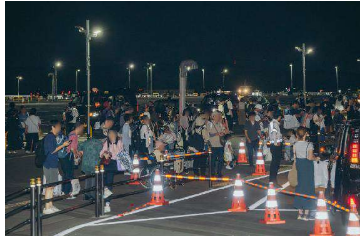
アプリタクシー到着待ちの様子