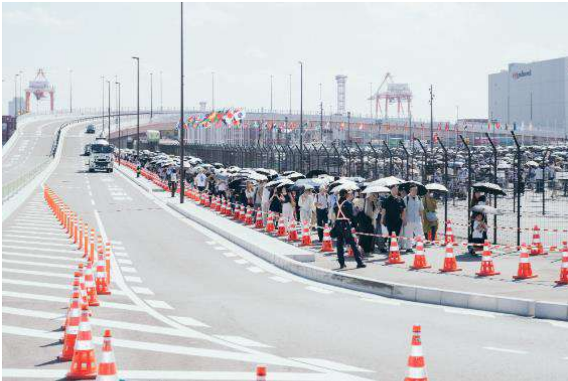
東エントランス付近