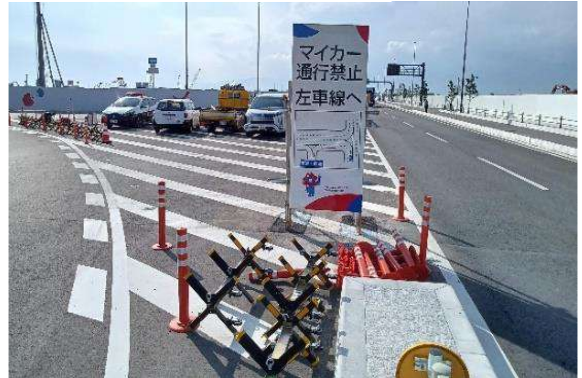
観光外周道路の看板設置状況