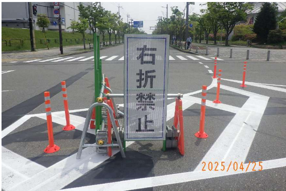
舞洲一方通行の看板設置状況