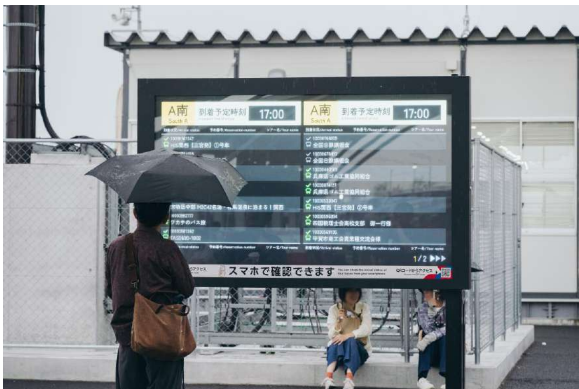
デジタルサイネージ