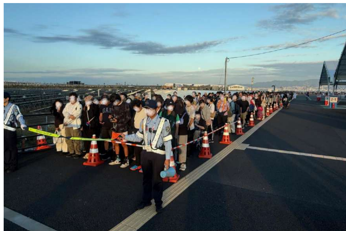
第2交通ターミナルにおける早朝来場者