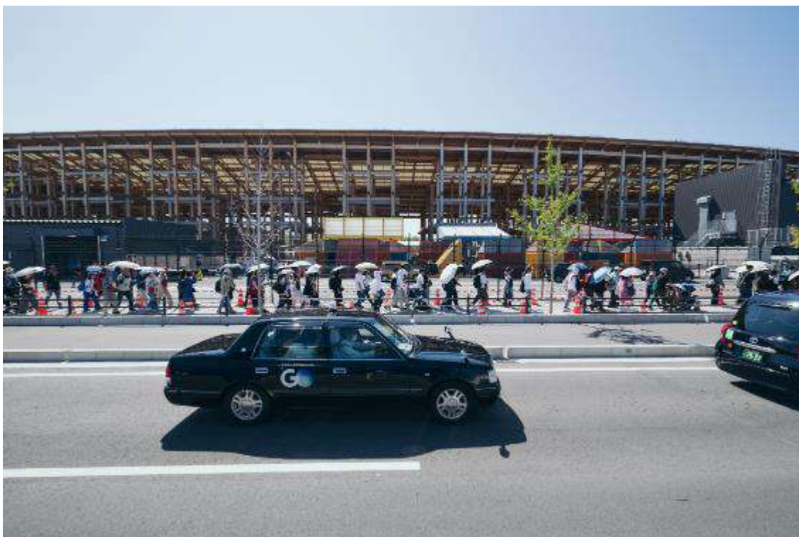
東エントランス広場から西ゲート間の歩行者