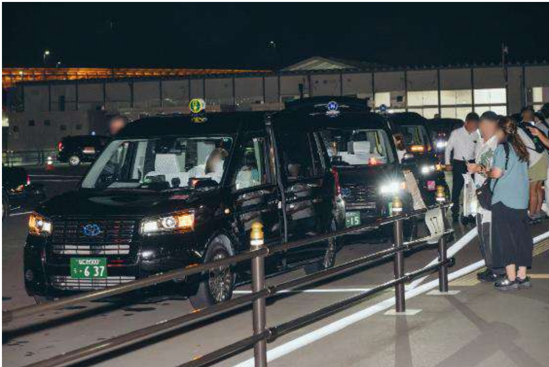
夜のアプリタクシー配車の様子