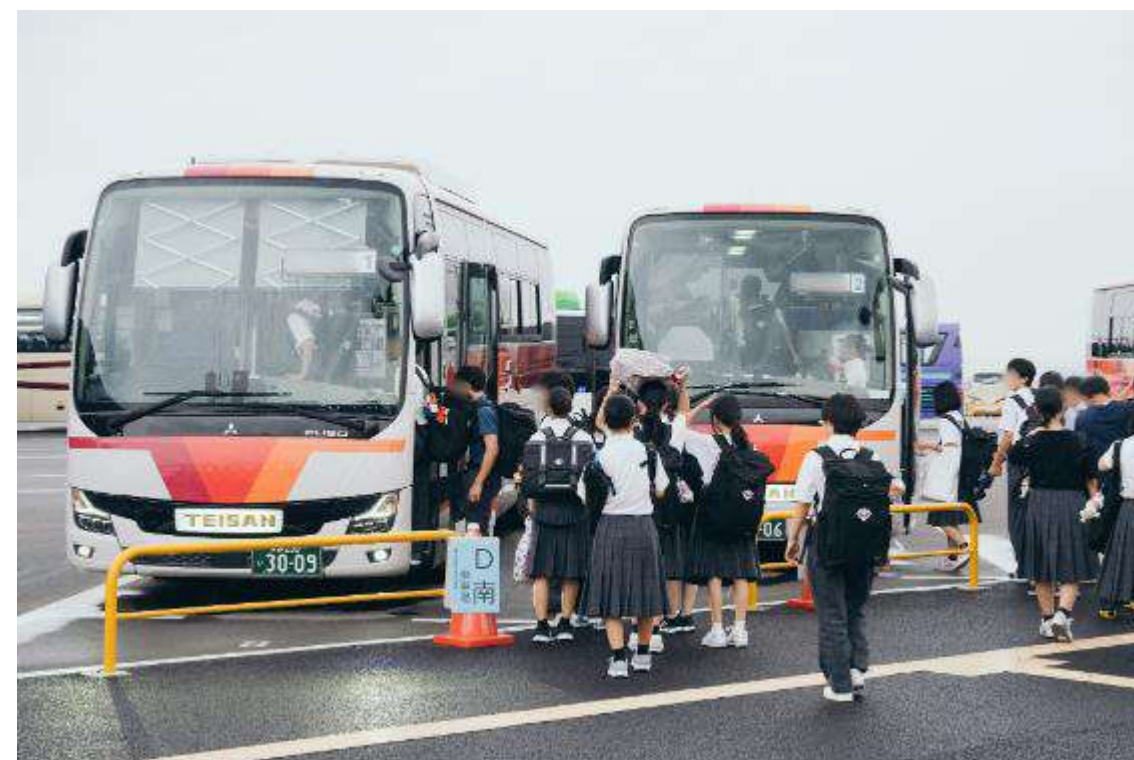
団体バス乗車の様子 (学生)