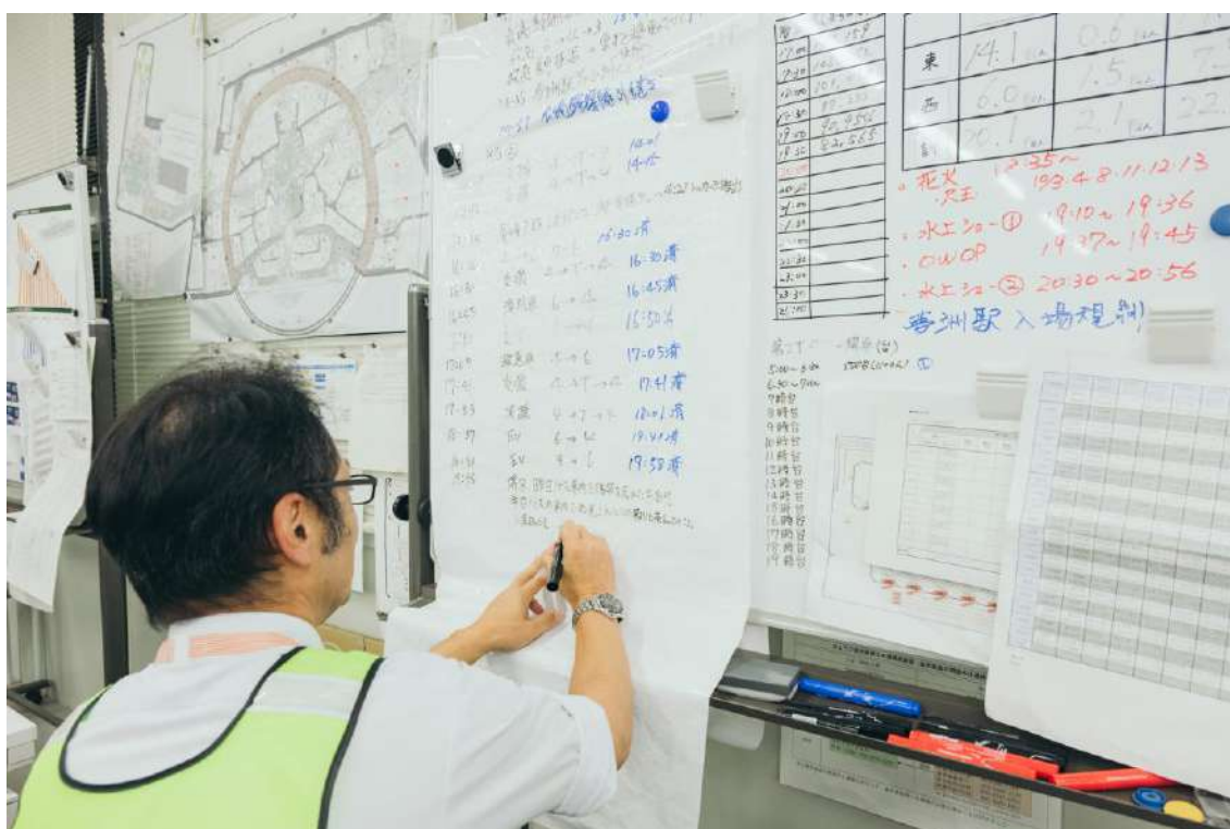
来場者輸送情報センター（ホワイトボード）