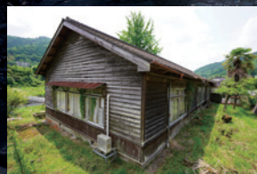
奈良県十津川村 旧折立中学校（左）