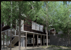
パビリオン全景(左)と、エントランス(右)