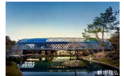
株式会社ROKI ROKI Global Innovation Center