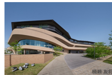
大和ハウスグループ みらい価値共創センター コトクリエ