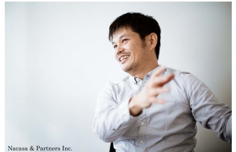
Nacasa & Partners Inc.