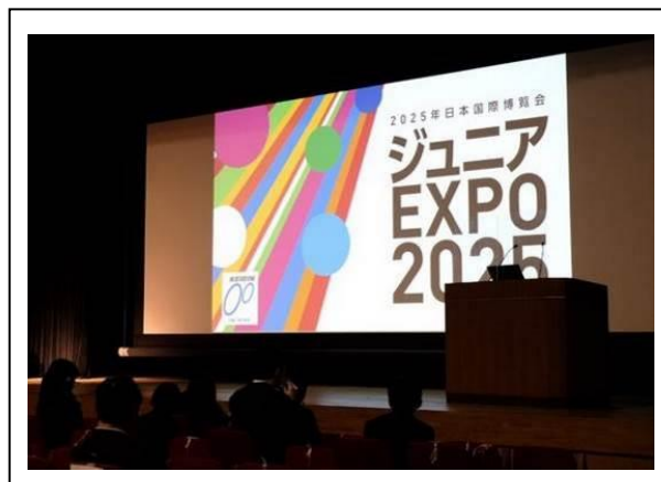
プレゼンテーション発表会（ジュニアEXPO）